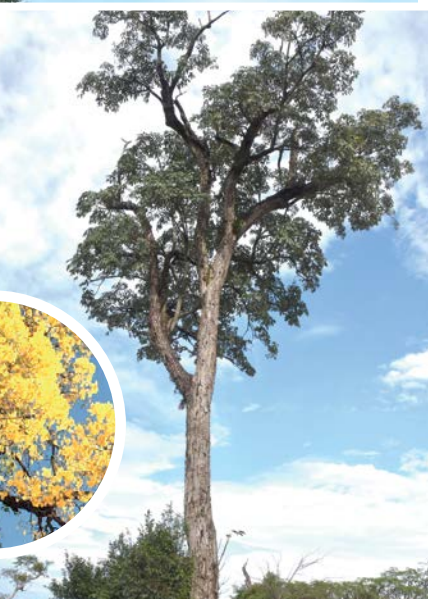
Lapacho amarillo ( Handroanthus albus )