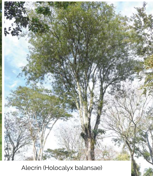
Alecrín ( Holocalyx balansae )