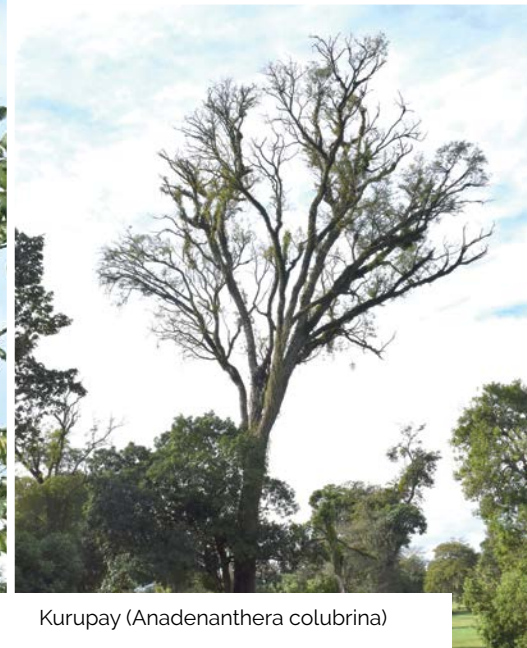
Kurupay ( Anadenanthera colubrina )