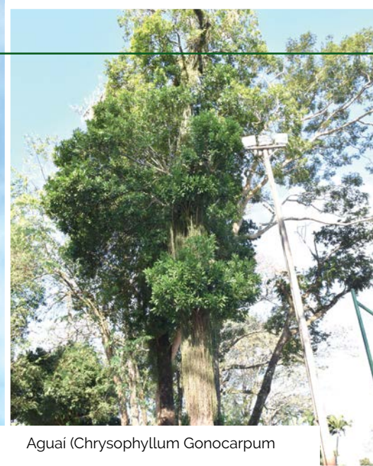
Aguái ( Chrysophyllum Gonocarpum )