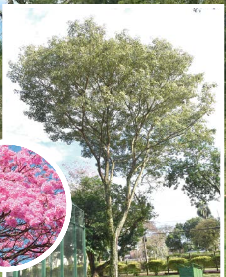
Lapacho rosado ( Handroanthus impetiginosus )