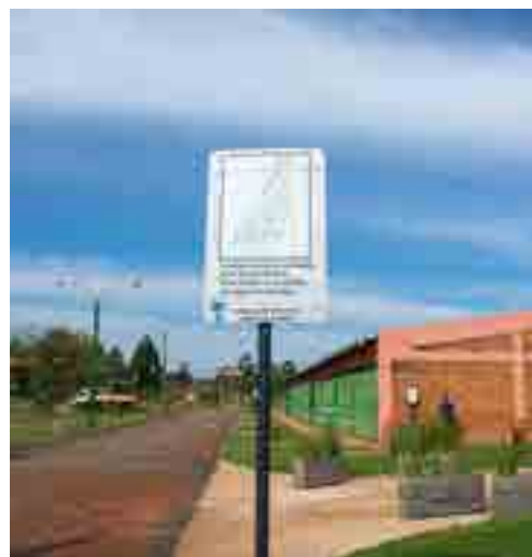
Señalización en Parque Urbano