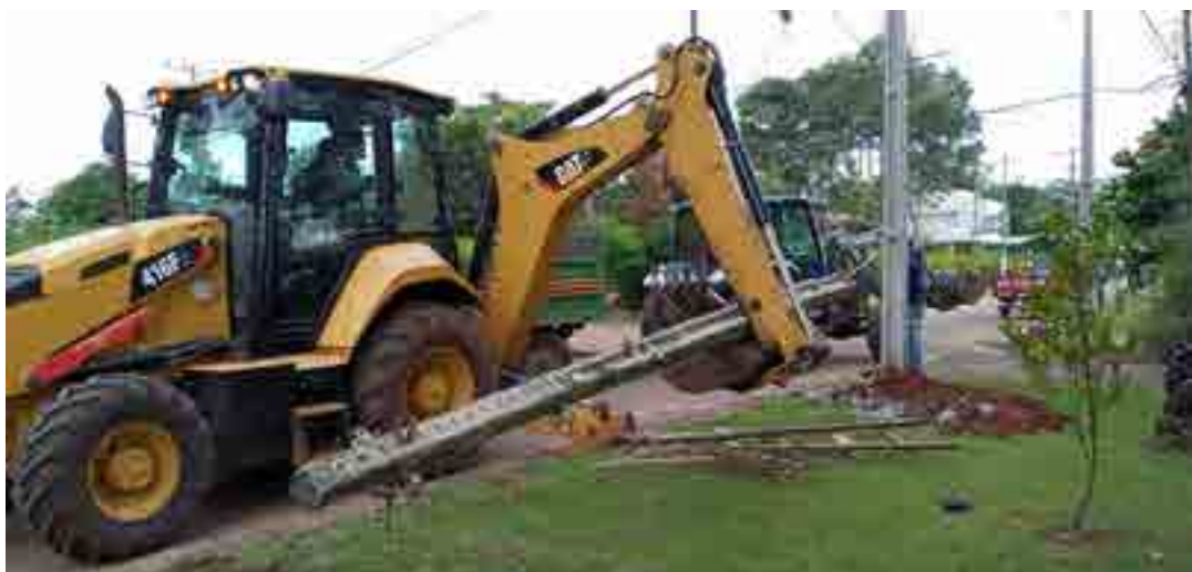
Retiro y reposición de columnas.