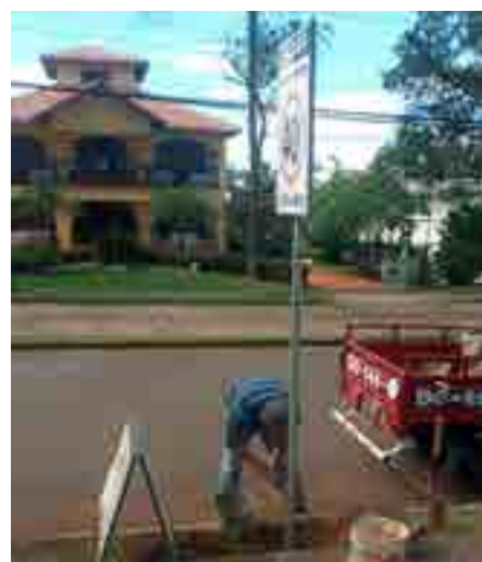
Colocación de carteles.