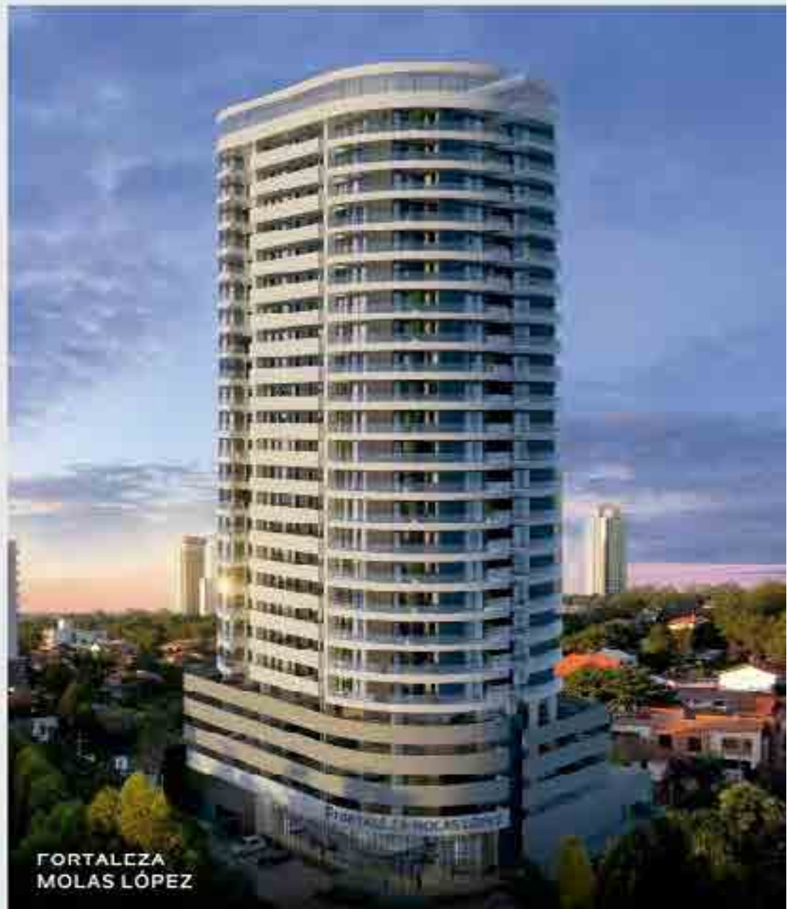
FORTALEZA MOLAS LÓPEZ