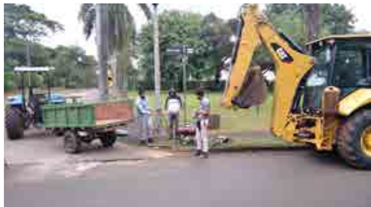
Reparación Avda. Paraná.